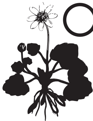
○ UN BUGALLÓN (flor amarela)