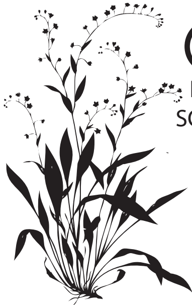
○ HERBA DO SOLLO (flores azuis)