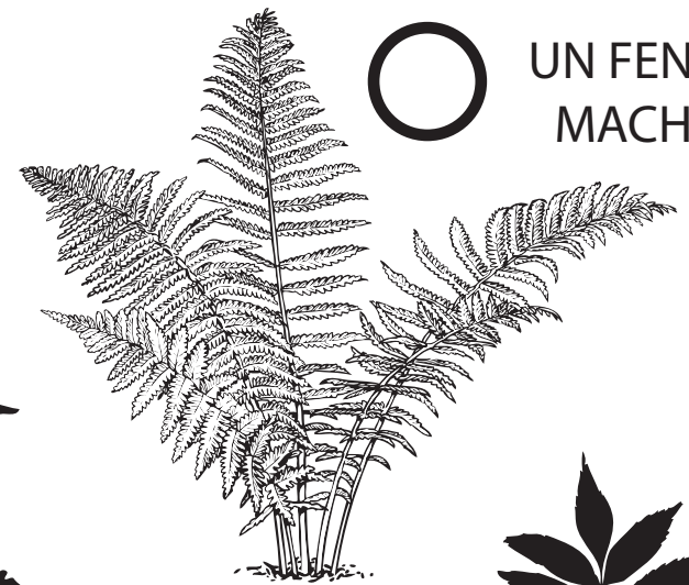
○ UN FENTO MACHO