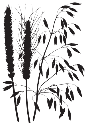
○ UNHA HERBA CON ESPIGAS