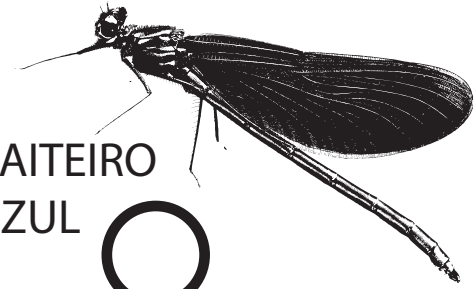
UN GAITEIRO AZUL