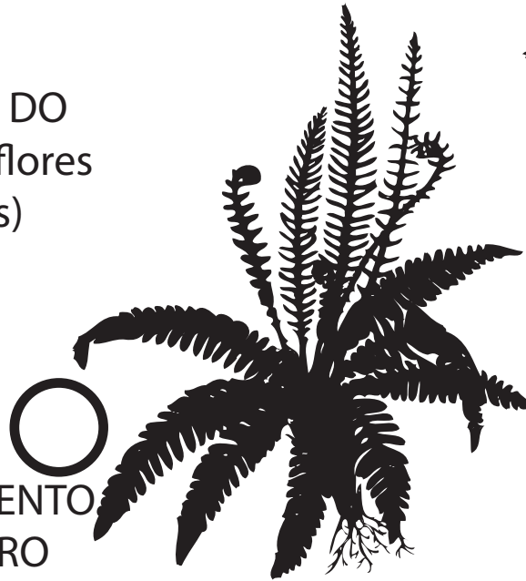
○ UN FENTO FERO