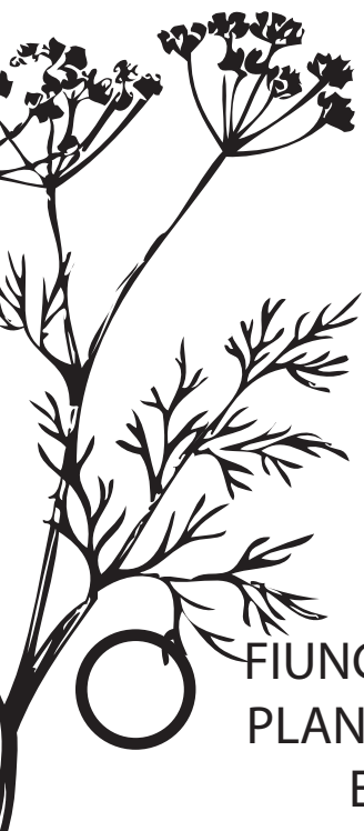
○ FIUNCHO, OU OUTRA PLANTA CON FLORES EN UMBELA