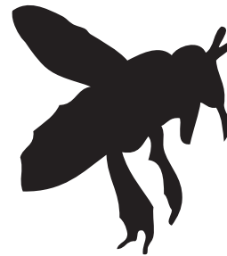
UNHA ABELLA OU ABELLÓN